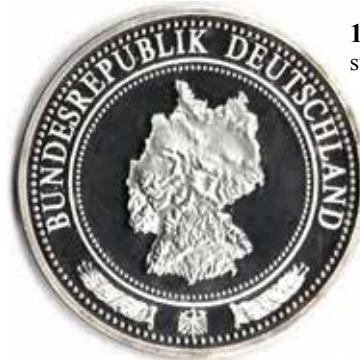
1114 stark verkleinert