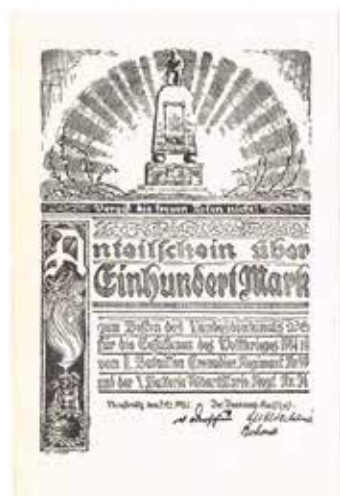
Los 2333 Anteilschein Landesdenkmal Mecklenburg-Strelitz 1922 Frühwerk von Erich Wessel

Komplette Druckbögen und Bogenteile in dieser Auktion.