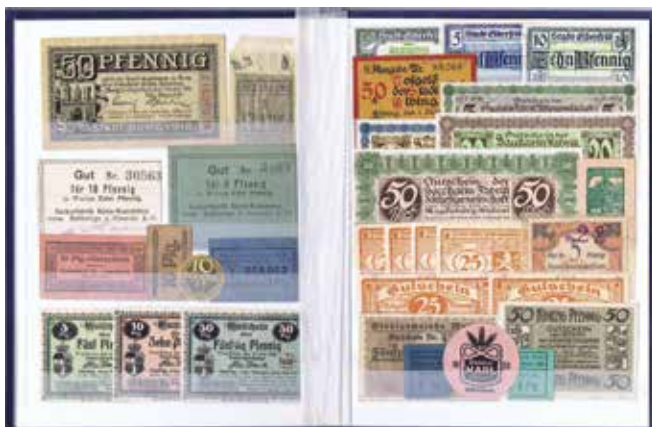
Doppelseite aus Album 2503