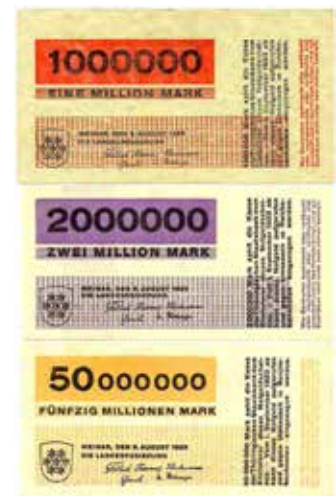
Lose 2229, 2232, 2234 Seltene Varianten der Bauhausentwürfe von Herbert Bayer aus einer Thüringensammlung.

Wir beraten Sie bei der Verwertung von Sammlungen aller Art. Wir vermitteln auch in Spezialauktionen weltweit. Besuchen Sie uns im Internet, in Zeuthen bei Berlin oder unserem Berliner Büro (siehe Umschlag vorn). Wir handeln alles zu Numismatik und Wirtschaftsgeschichte, daneben vermitteln wir gern für Sie: