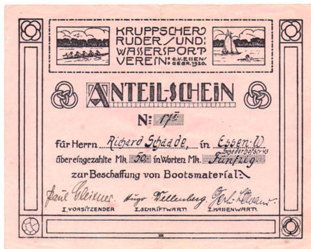
aus der Sammlung 1100 KRUPP Anteilschein einmal anders mit Originalunterschriften der Kruppiener 1920